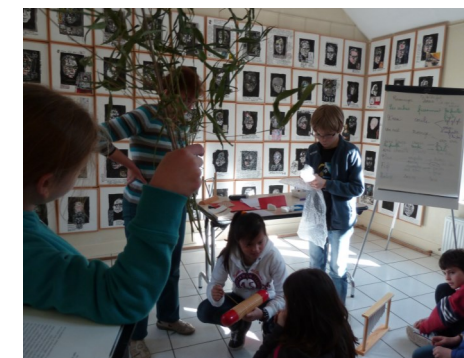
Cette semaine, des élèves de Cm2 mettent en musique des poèmes à la Maison Elsa Triolet-Aragon à Saint-Arnoult en Yvelines...

C'est le moment aussi de vous inscrire pour obtenir le label école en poésie : rien de plus facile. Il suffit que votre classe ou votre école ait réalisé cinq des quatorze items proposés ou même que vous en inventiez ! Rendez vous sur le site